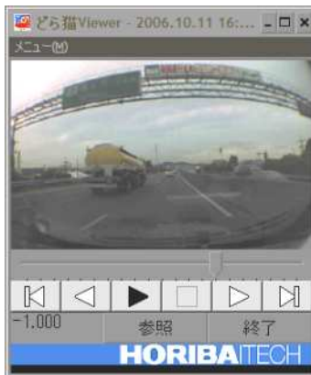
高速道路の画面です